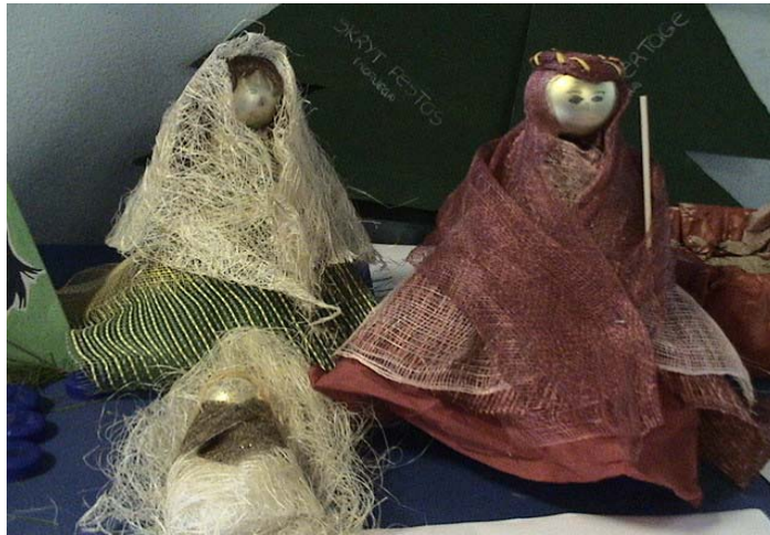
9 ano/grade 4 turma/class