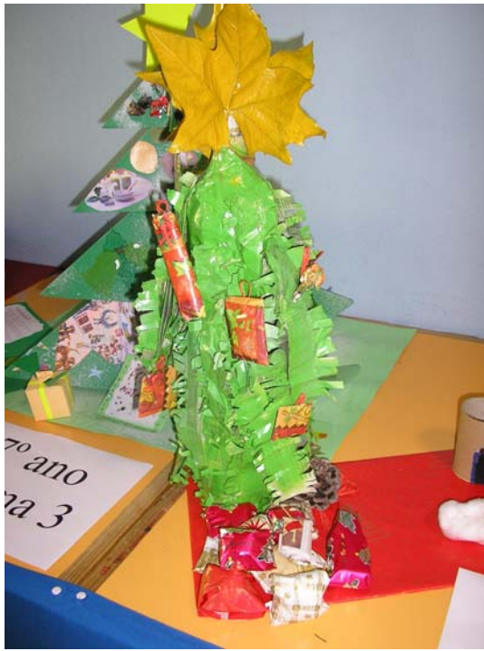
7 ano/grade 2 turma/class