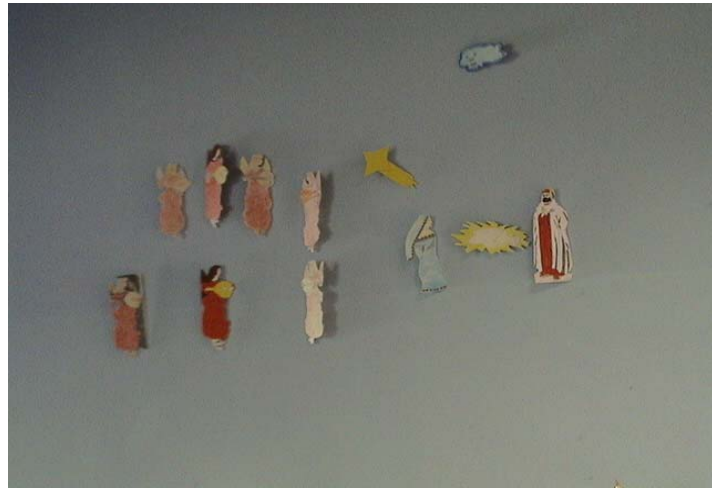
8 ano/grade 2 turma/class