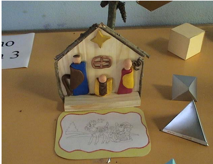
7 ano/grade 3 turma/class