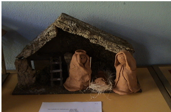
9 ano/grade 4 turma/class