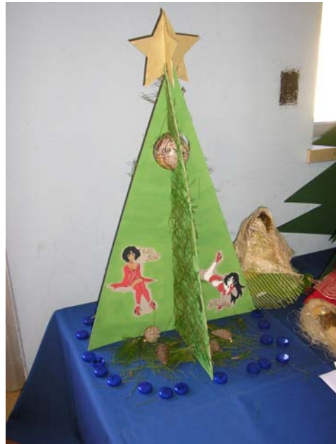
7 ano/grade 3 turma/class