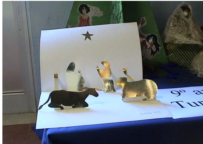
9 ano/grade 1 turma/class