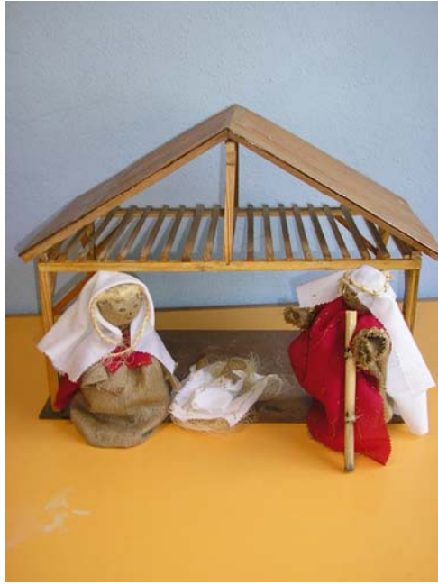
9 ano/grade 3 turma/class